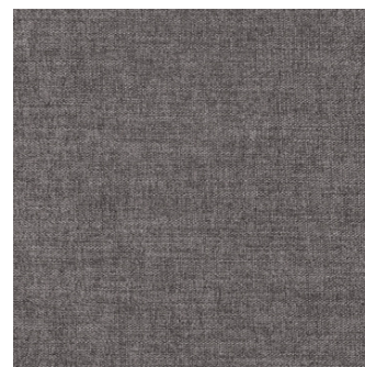
282 Avella, Warm Grey