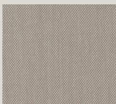
Steelcut - 213