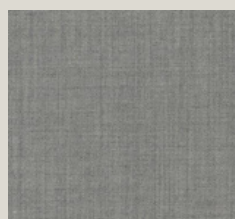
Remix - 123