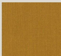
Steelcut - 453