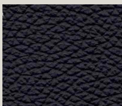
Nero - 9024