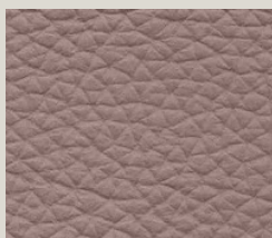
Pietra - 9007