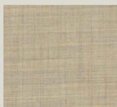
Remix - 223