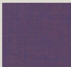
Remix - 686