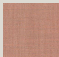
Remix - 612