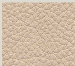
Sabbia - 9004