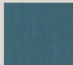
Steelcut - 983

Boiserie Riva srl 00199 Roma - Via Nemorense 37/c Tel. +39068845 253- P.IVA e C.F 05 229581003 info@riva.it - https://www.riva.it