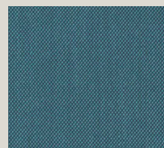
Steelcut - 983

Boiserie Riva srl 00199 Roma - Via Nemorense 37/c Tel. +39068845 253- P.IVA e C.F 05 229581003 info@riva.it - https://www.riva.it