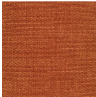
412 Esina, Rust Orange