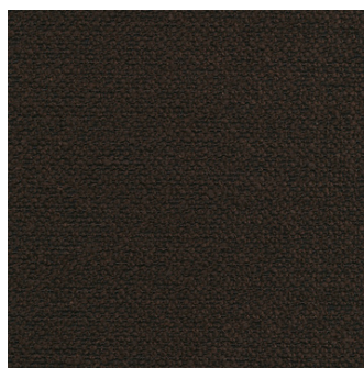
358 Taura, Chocco