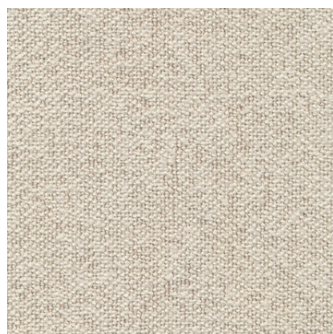
357 Taura, Off White