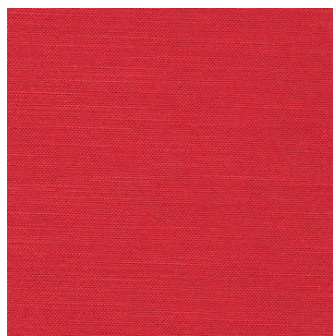
511 Elegance, Red