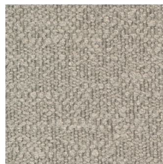
539 Bouclé, Beige