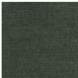
281 Avella, Pine Green