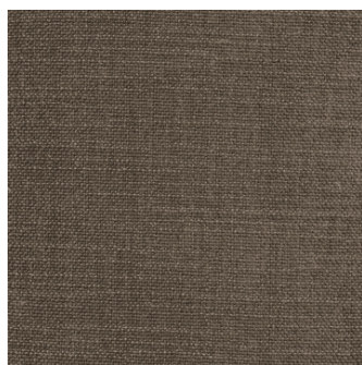
411 Esina, Cedar Brown