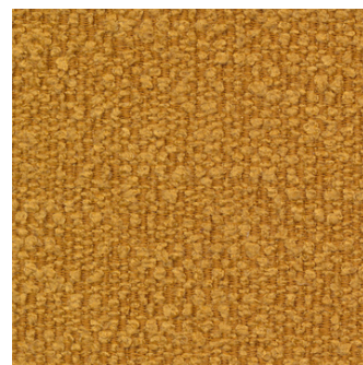
536 Bouclé, Ochre