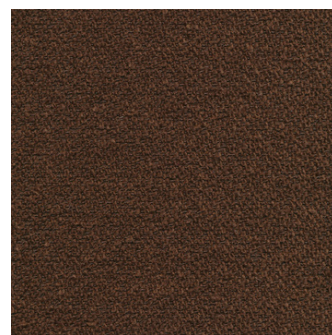
359 Taura, Cappuccino